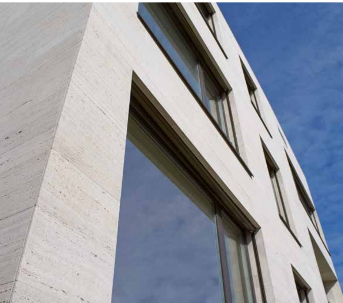
Mehrfamilienhaus in Rüschtikon Riemchenfassade in Travertin offenporig gesägt 10 / 15 / 20 / 25 / 30 cm hoch, freie Längen