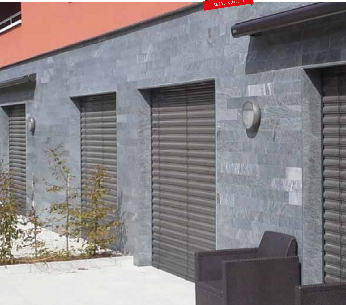
Mehrfamilienhaus in Schlieren Riemchenfassade in Onsernone geschliffen, 9.8 cm hoch, freie Längen