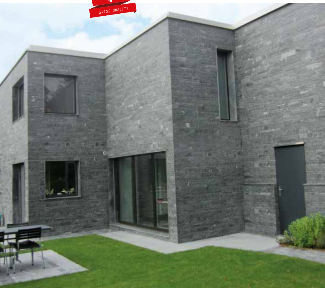
Einfamilienhaus in Widen Riemchenfassade in Osernone bruchroh 4.8 / 9.8 cm hoch, freie Längen