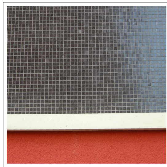
Übergang Mosaik - Verputz