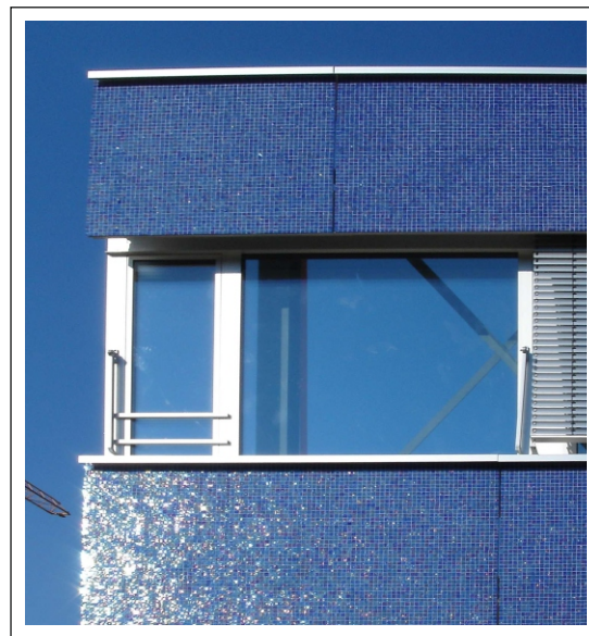
Extrait de la façade

Nos spécialistes des processus système forment un réseau dense dans toutes les régions linguistiques de la Suisse.